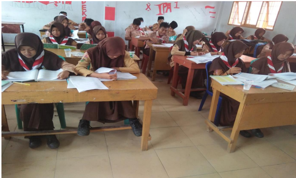
Gambar 3. Suasana Pretes di kelas Ceramah