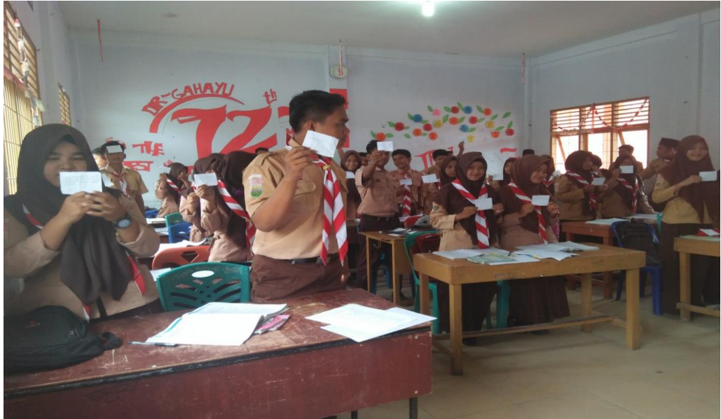
Gambar 4. Suasana Postes dikelas Make a Match