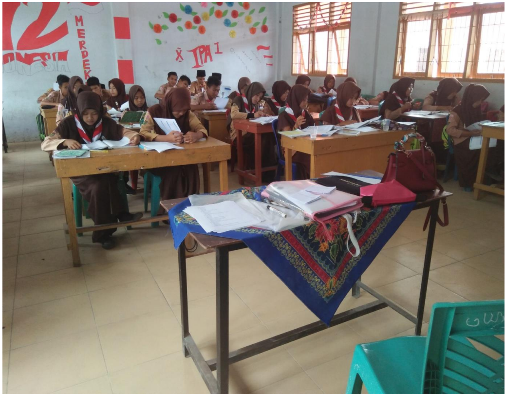
Gambar 2. Suasana Pretes di kelas Make a Match