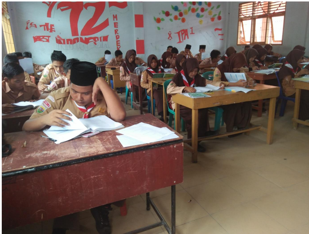
Gambar 5. Suasana Postes dikelas Ceramah