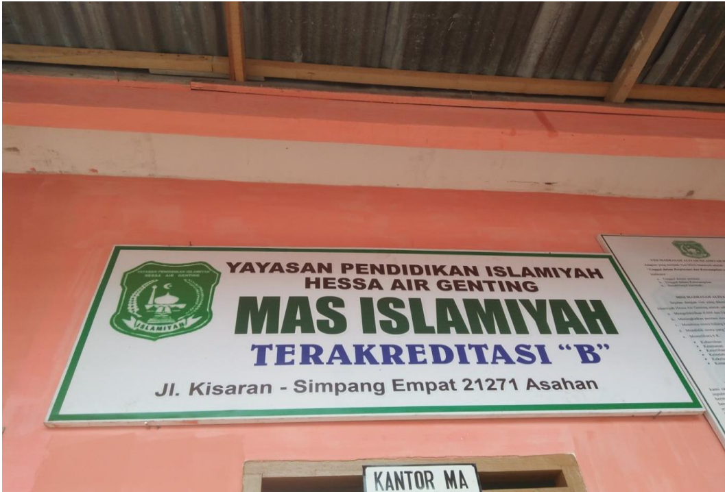
Gambar 1. Papan Nama MAS Islamiyah HAG