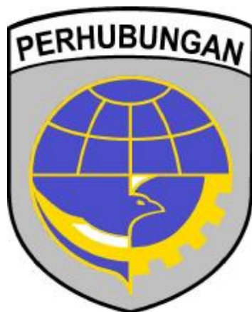
Gambar 3.2 Logo Dinas Perhubungan Kota Medan