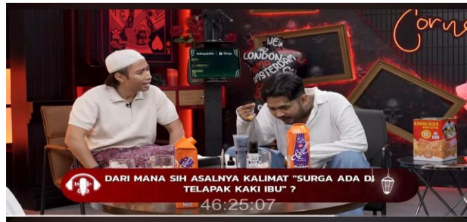
Gambar 4. 12 Scene Onad Bertanya Kenapa Surga Di Telapak Kaki Ibu

Onadio : “dari mana sih asalnya kalimat surga ada di telapak kaki ibu itu ada dalam quran,kenpa gak bapak”?