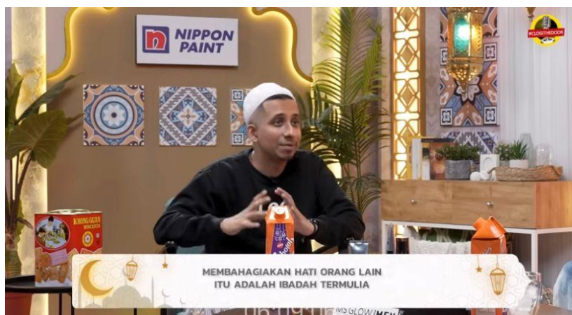
Gambar 4. 1 Scene membahagian orang itu ibadah yang mulia