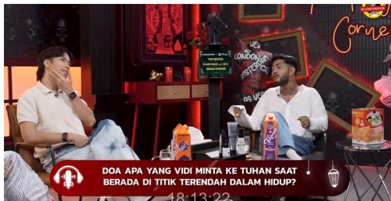
Gambar 4. 6 Scene onad nanya kepada vidi tentang doa apa yang di sebutkan.

Onadio : “waktu dalam keadaan sholat kamu kan pengen rilis banget, aku pengen rilis aku gak tau cerita kesiapa doa apa yang kamu sebutkan, apa kamu nyerah “tuhan aku udah nyerah ni”?”