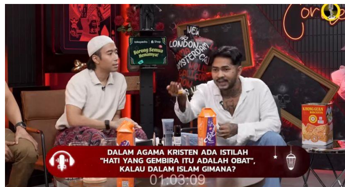
Gambar 4. 14 Onad Bertanya Kalau Hati Yang Gembira Dalam Islam Apa?