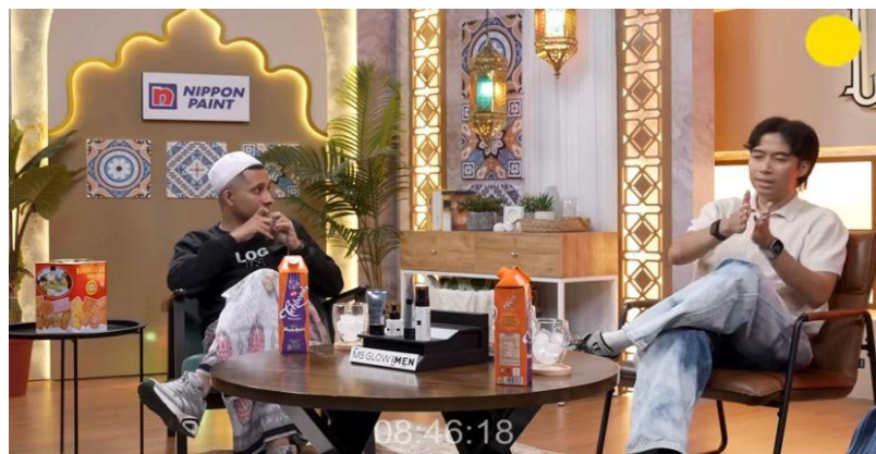
Gambar 4. 2 Scene vidi menceritakan kenapa vidi tidak percaya tuhan

Vidi : karna gak ada space buat percaya,rasanya tidak di kasih space secara utuh karna dari kecil kan gua sekolah islam kan,jadi kayak emang di ajari teknis teknisnya kayak di kasih tau reward and punishment dalam agaman ini dimana rasanya kalau