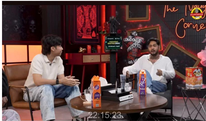
Gambar 4. 8 Scene Onad Bertanya Kalau Tidak Ada Rasa Kangen Itu Kepada Tuhan

Onadio : vid seandainya pada saat itu lo dapat lingkungan bermacam macam ada hindu aknostik, nah bib misalnya vidi akan baik baik aja dan dia tidak menemui rasa kangen itu bahkan vidi sempat aknostik seandainya dia melakukan terus gak ada rasa kangennya oke nggak ?