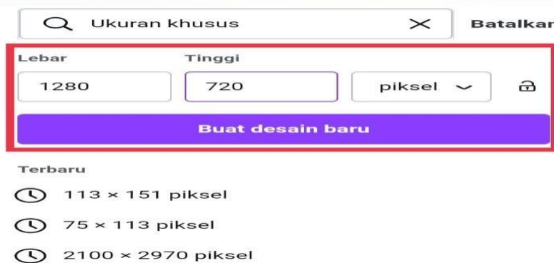
Gambar 2. Icon untuk mengatur ukuran kertas

2) Memilih icon ukuran kertas untuk mengatur size sesuai dengan kebutuhan.