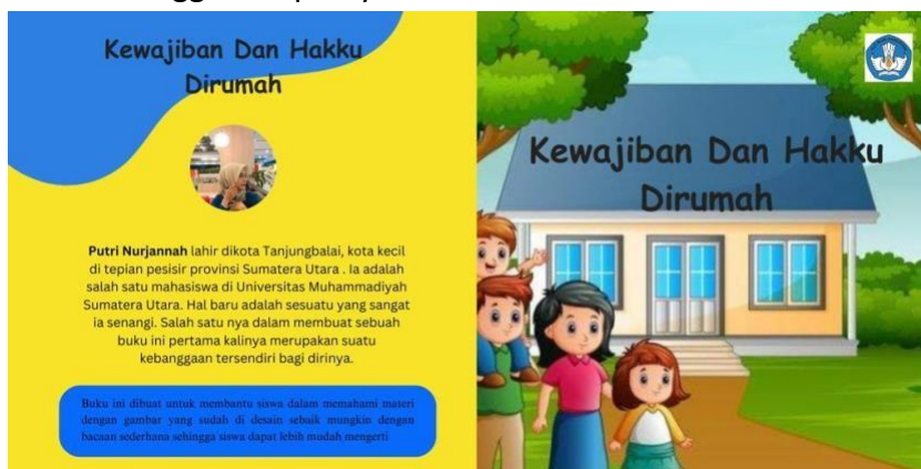
Gambar 5. Contoh layout pada Cover depan/belakang buku.