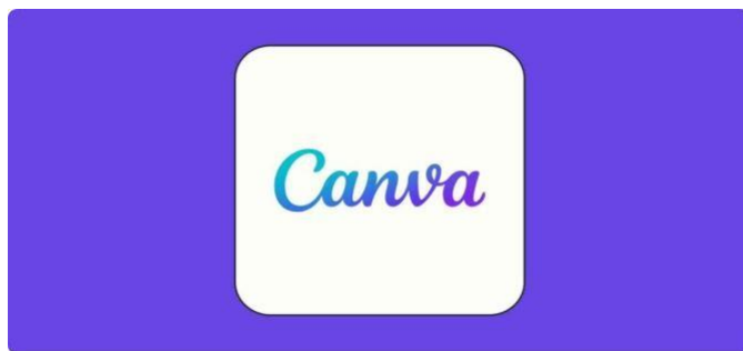
Gambar 1. Aplikasi canva

2) Memilih icon ukuran kertas untuk mengatur size sesuai dengan kebutuhan.