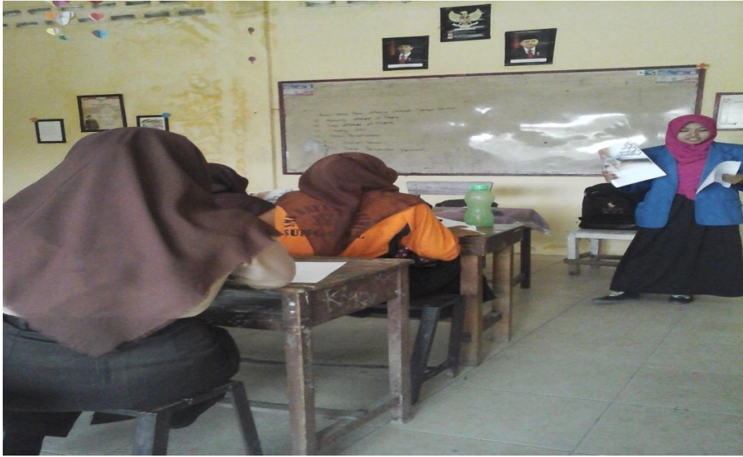
Guru sedang menjelaskan Materi Pembelajaran