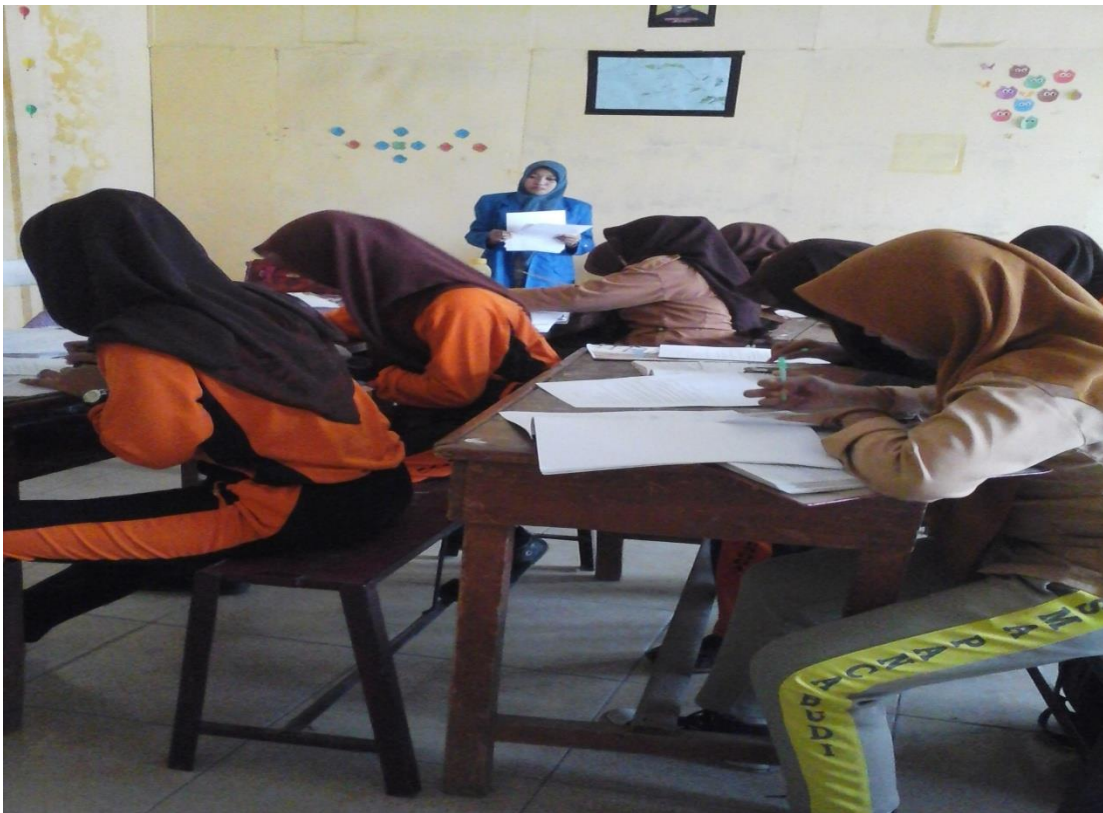
Siswa sedang mengerjakan soal latihan yang terdapat pada Media