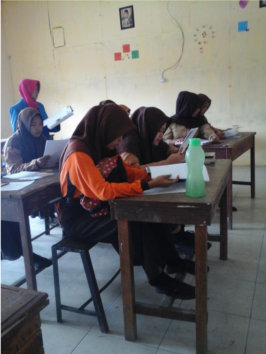
Siswa sedang mendengarkan Pembelajaran Yang disampaikan oleh Guru