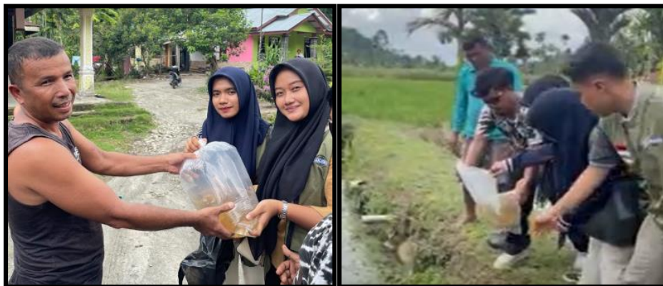
Gambar 3 Penyebaran Bibit Ikan

disebar dan dituang beberapa lokasi kolam di Desa Suka Makmur guna pemerataan kegiatan.