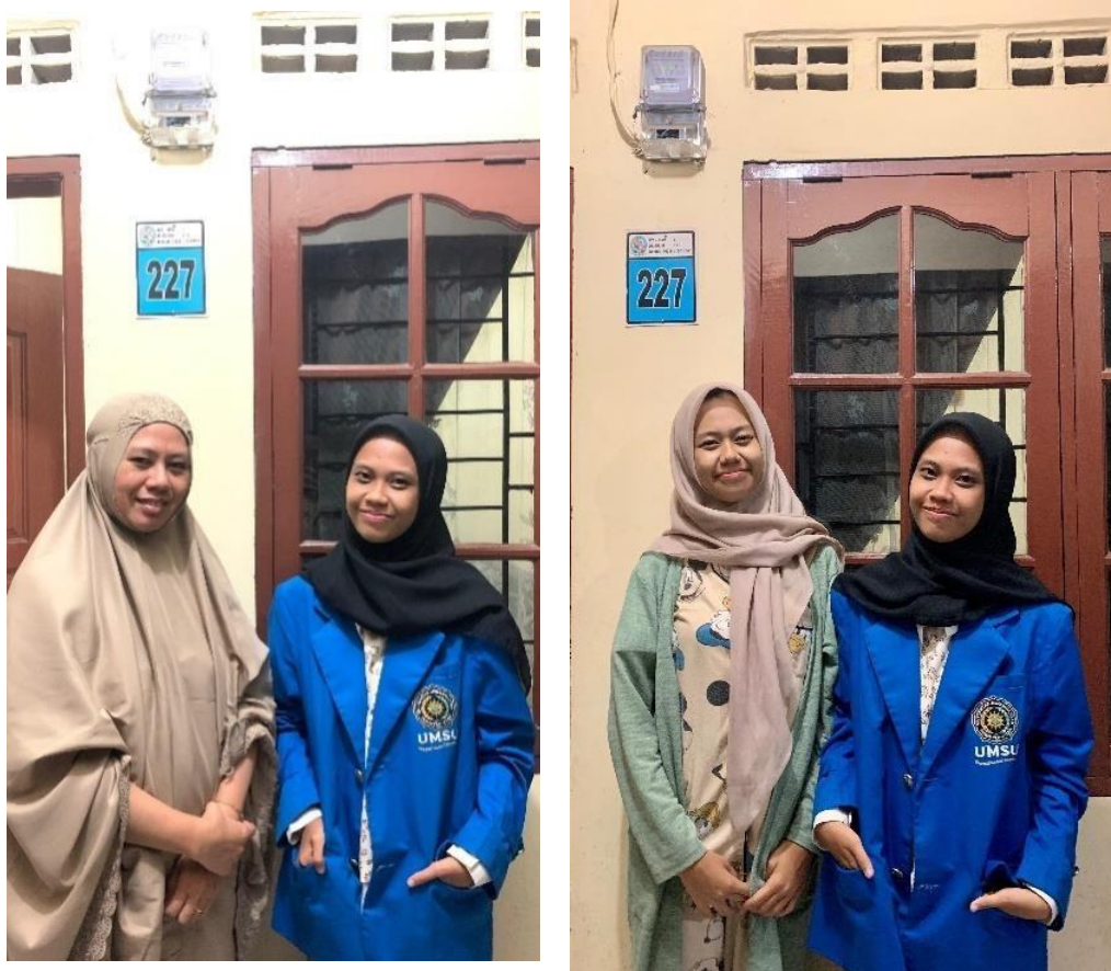
Gambar 4.3 Foto Bersama Salah Satu Masyarakat Desa Medan Krio Dusun II