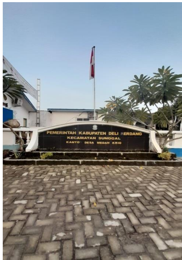
Gambar 4.4 Kantor Desa, Kepala Dusun