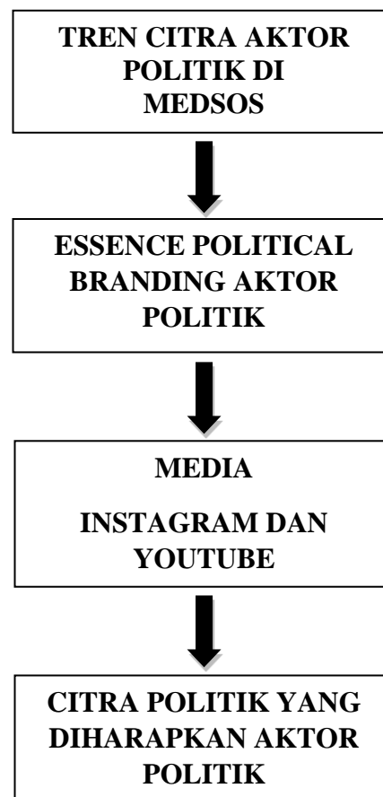
Tabel 3.1. Kerangka Konseptual

Dalam pelaksanaan penelitian ini, kerangka konsep dibuat untuk mempermudah dalam penyusunan skripsi ini dan menjadi penilaian yang lebih sistematis. Berdasarkan judul penelitian, maka kerangka konsep yang dipakai dalam penelitian ini dapat digambarkan sebagai berikut.