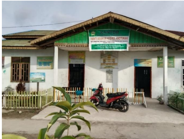
Gambar 2. Lokasi Panti Asuhan Husnul Khotimah

Berikut adalah visi dan misi Panti Asuhan Husnul Khotimah: