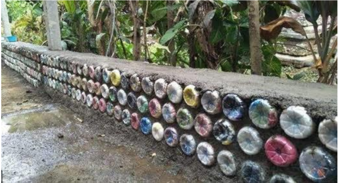
Gambar 4. 3 Tanggul Manual

dilakukan untuk mencegah agar tidak terjadinya bencana banjir yang mengakibatkan pencemaran lingkungan tidak sehat.