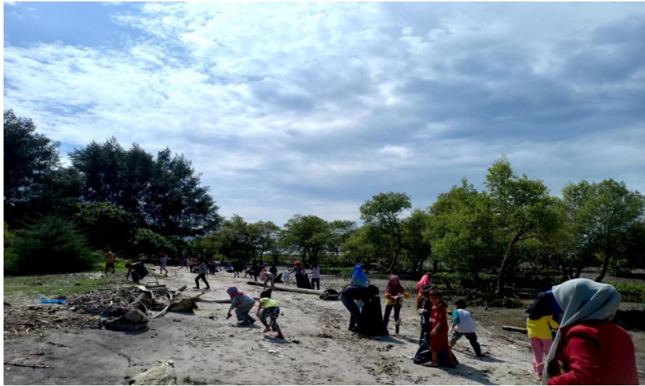
Gambar 4. 1 Mengutip Sampah