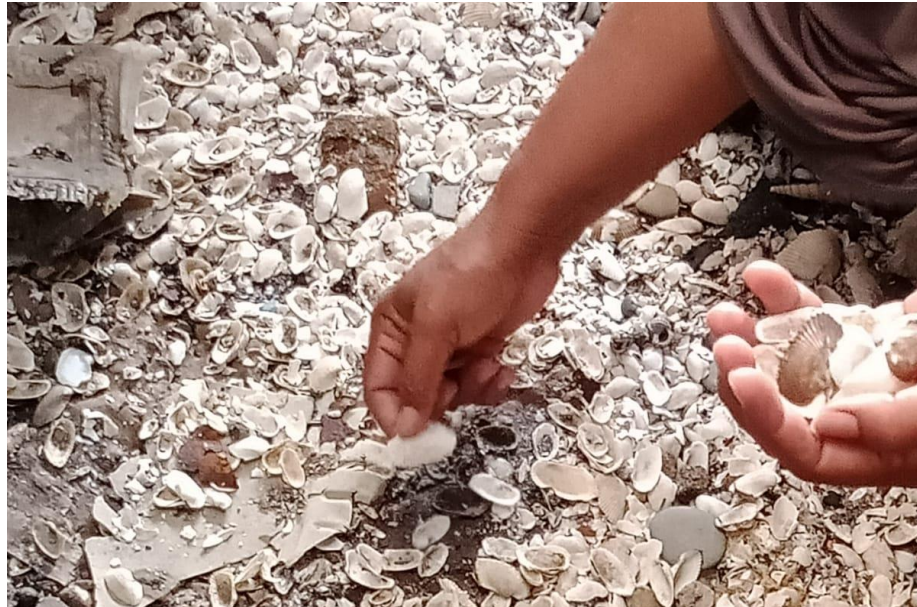
Gambar 4. 4 Mengutip Cangkang Kerang