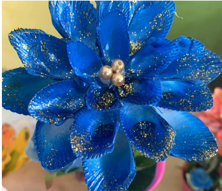
Gambar 4. 5 Hasil Kerajinan Cangkang Kerang