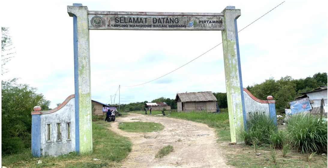
Gambar 3. 1 Pintu Masuk Pantai Labu

Diversifikasi ekonomi masyarakat desa wisata melalui usaha unit kemaritiman yang ada di Kecamatan Pantai Labu, Kabupaten Deli Serdang. Memiliki hambatan dalam pengembangan pantai yang untuk dijadikan pariwisata pada desa wisata.