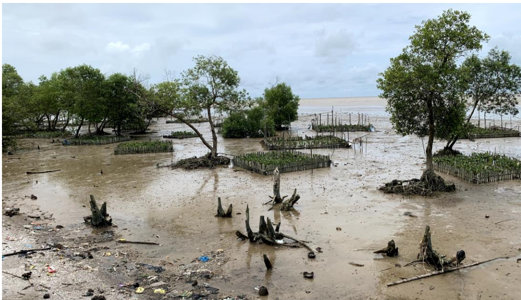
Gambar 4. 2 Penanaman Pohon Mangrove