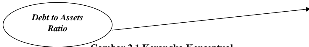
Gambar 2.1 Kerangka Konseptual