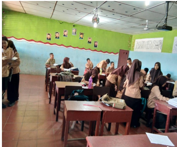
Gambar Ruang Kelas IIS 2