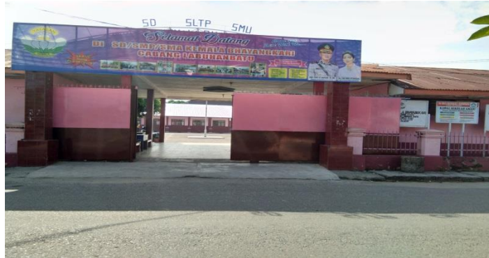
Sekolah SMA Swasta Bhayangkari 2 Rantauprapat