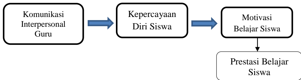
Gambar. 2.1. Kerangka Pemikiran

Aktivitas komunikasi interpersonal guru diharapkan nantinya dapat meningkatkan prestasi belajar sesuai dengan harapan dan keinginan dari pihak guru, orangtua atau siswa itu sendiri.