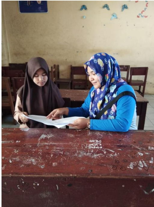
Gambar Wawancara dengan Informan Siswa