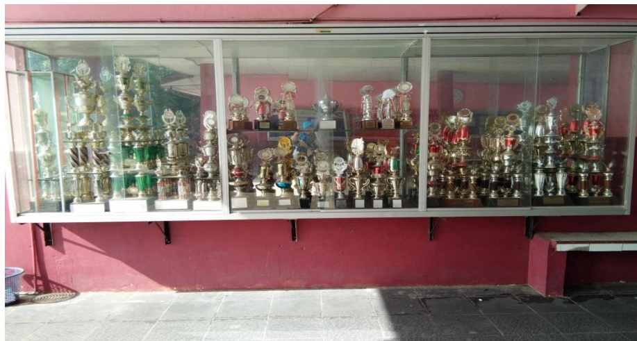
Piala yang di raih SMA Swasta Bhayangkari 2 Rantauprapat