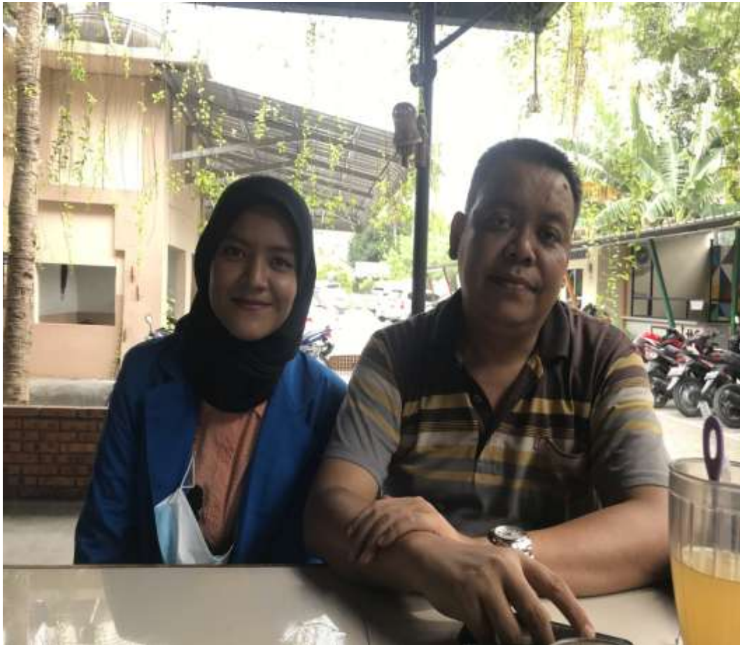
Narasumber 1 : Taufik Hidayat