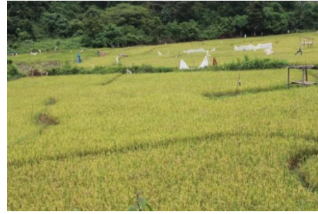
Perkebunan dan persawahan masyarakat