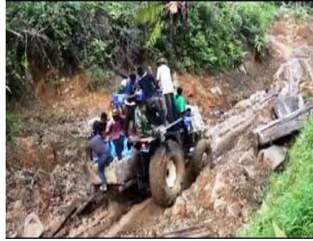
Alat transportasi menuju kampung lesten / Desa lesten