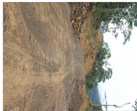
Akses jalan menuju Desa Lesten