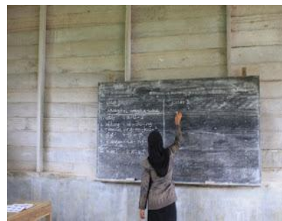
Akses pendidikan Desa Lesten