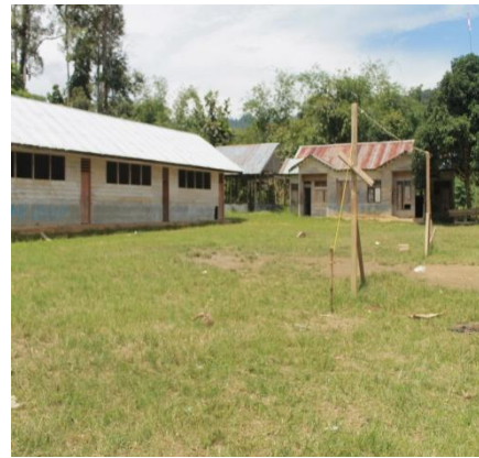
Sekolah Dasar di Desa Lesten