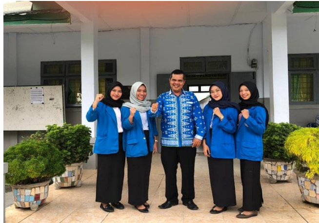
FOTO DOKUMENTASI DI SMK NEGERI 1 PERBAUNGAN TAHUN PEMBELAJARAN 2018/2019