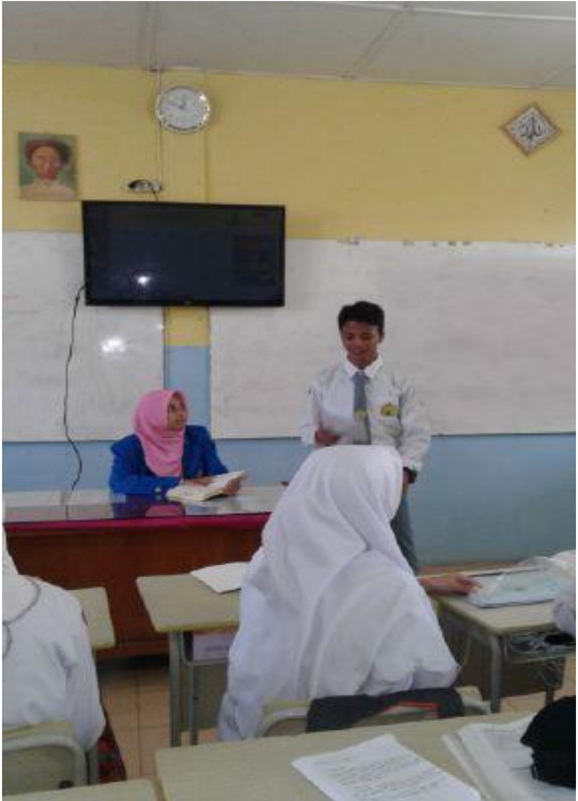
(Siswa Menjelaskan Kembali Yang Dijelaskan Oleh Guru)