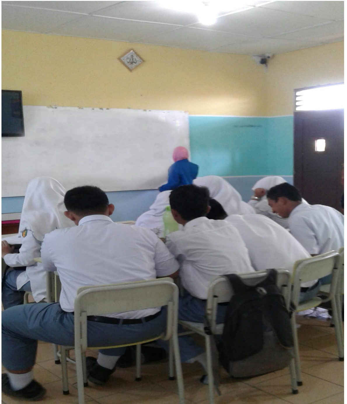
(Guru Menjelaskan Pelajaran)