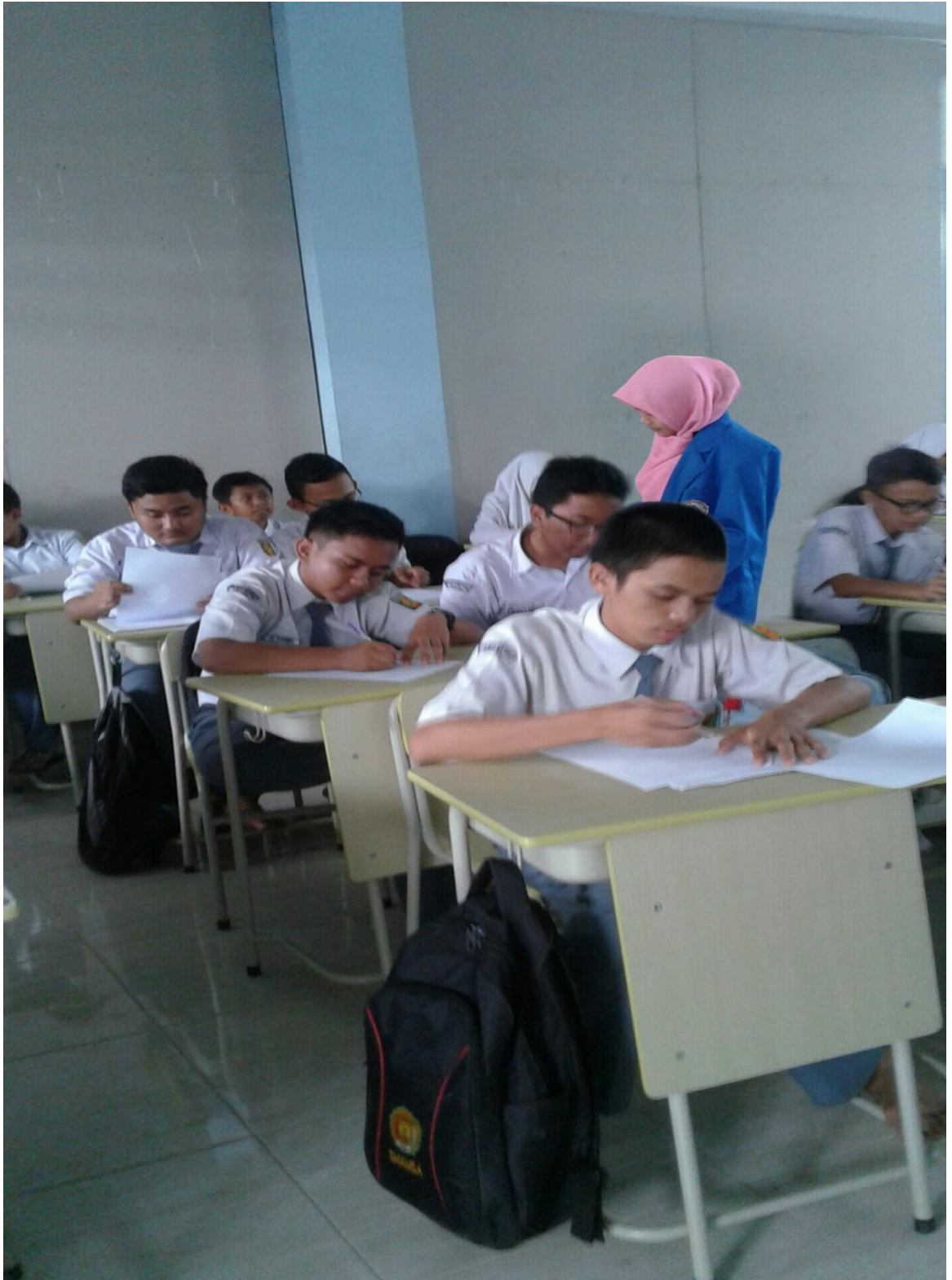
(Guru Membagikan Soal)