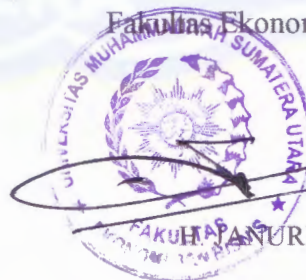
HANURI, SE, MM, M.Si