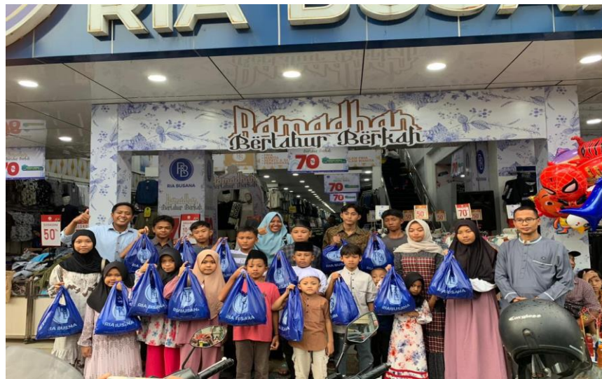
Gambar 3.1 Penyaluran bantuan kepada anak yatim