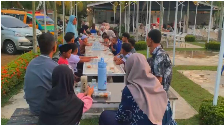
Gambar 6.2 Makan Bersama Anak Yatim