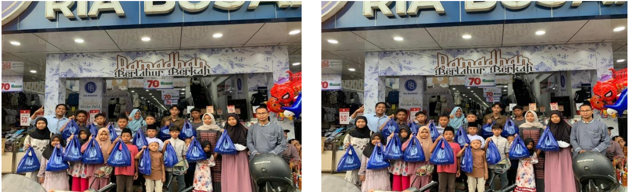
Gambar 6.1 Penyaluran Bantuan Kepada Anak Yatim