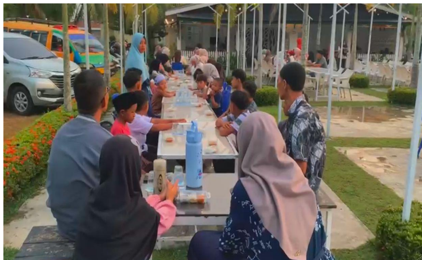
Gambar 3.2 Makan bersama anak yatim