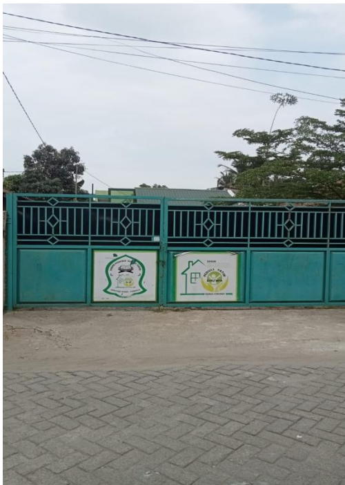
Gambar 4.8. Gerbang Depan