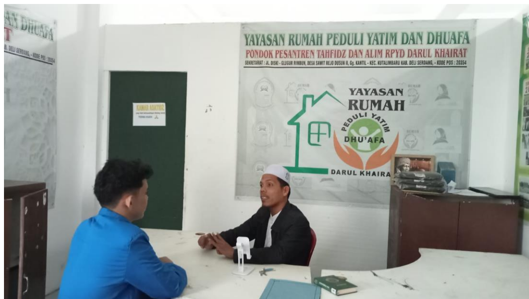
Gambar 4.11. Proses Wawancara

Dengan demikian, keteladanan menjadi strategi utama yang paling efektif dalam pembinaan akhlak santri, karena santri cenderung meniru perilaku yang mereka lihat secara langsung.