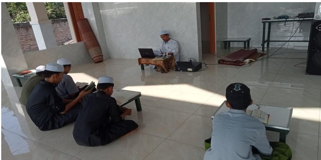
Gambar 4.22. Proses Belajar Mengajar

Dengan demikian, pemberian nasehat menjadi strategi yang efektif dalam menyentuh aspek kesadaran dan pemahaman santri terhadap nilai-nilai akhlak.