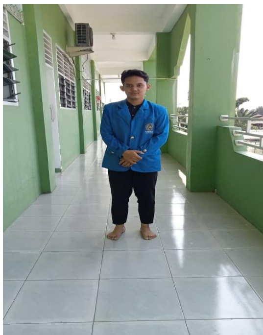
Gambar 4.2. lantai 2