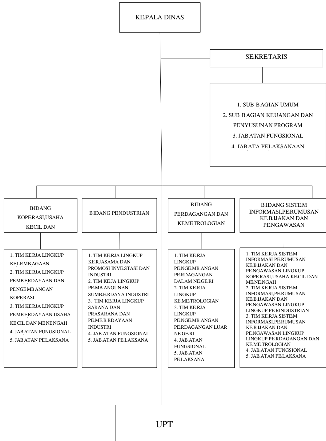
Gambar 3.9.1 Struktur Birokrasi Dinas Koperasi Usaha Mikro, Kecil dan Menengah