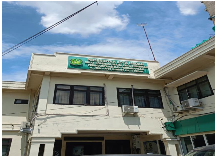
Gamabr 3.8. Kantor Dinas Koperasi Usaha Mikro, Kecil dan Menengah

Penelitian ini dilaksanakan selama kurun waktu empat bulan. Lokasi penelitian difokuskan pada Dinas Koperasi dan Usaha Mikro, Kecil, dan Menengah (UMKM) Kota Medan serta pada pelaku UMKM yang berada di Kecamatan Medan Denai, sebagai lokasi pelaksanaan implementasi Peraturan Daerah Kota Medan Nomor 3 Tahun 2024 tentang Perlindungan dan Pengembangan UMKM.