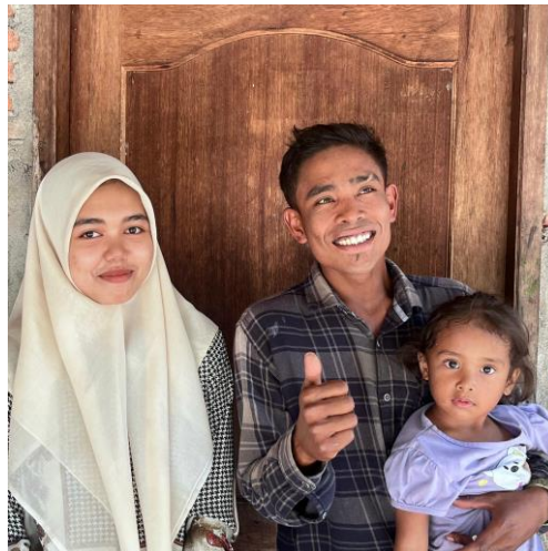
Narasumber 5 & 6