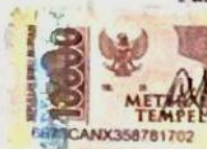
Asty Dwi Yoja