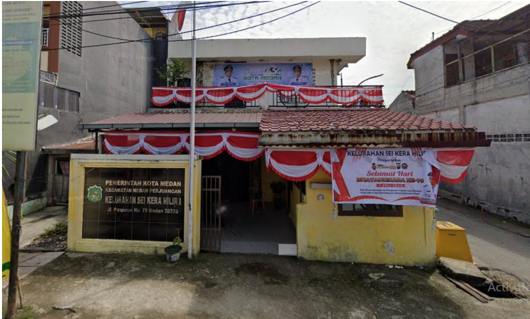
Gambar 4. 1 Kelurahan Sei Kera Hilir 1