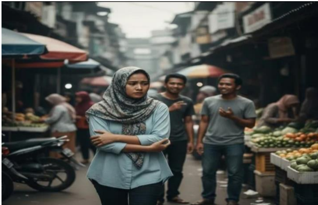
Gambar 2.1 2 Bentuk Fenomena Catcalling di Ruang Publik

Catcalling merupakan salah satu bentuk pelecehan seksual yang bersifat non-fisik dan dilakukan melalui komunikasi verbal di ruang publik. Dalam kajian kontemporer, catcalling didefinisikan sebagai tindakan memberikan komentar, siulan, panggilan, atau ucapan bernuansa seksual yang tidak diinginkan oleh korban, yang umumnya ditujukan pada tubuh, penampilan, atau seksualitas seseorang. Tindakan ini termasuk dalam kategori pelecehan seksual karena mengandung unsur seksual serta menimbulkan ketidaknyamanan bagi korban (Gardner, 1995; Kears, 2010).