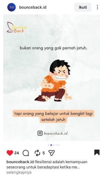
Gambar 4.1 Karikatur Resiliensi Akun Instagram @bounceback.id