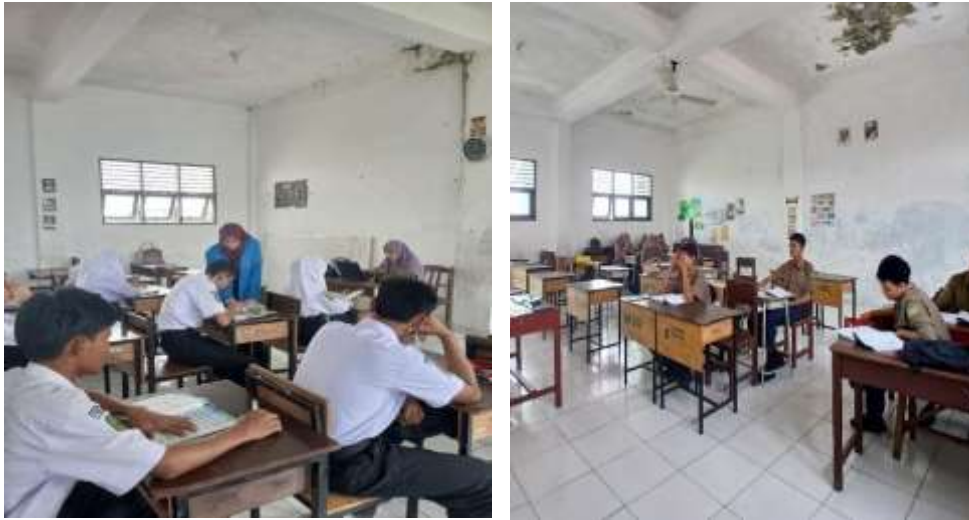
Gambar 2.4 proses penerapan metode cerita pada mata pembelajaran Pendidikan Agama Islam SMK Muhammadiyah 06 Medan