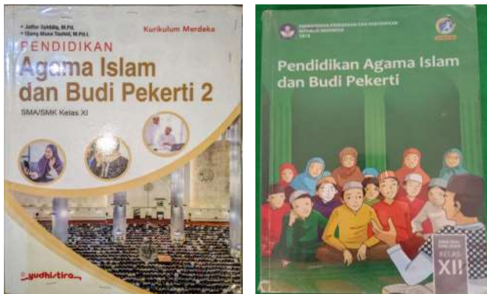
Gambar 2.5 Buku Pelajaran Pendidikan Agama Islam SMK Muhammadiyah 06 Medan