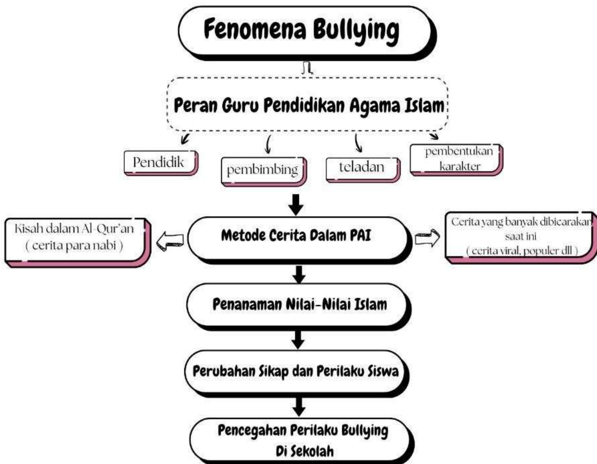
Gambar 2.1 Bagan Kerangka Berfikir

Berdasarkan kerangka berfikir di atas, dapat di lihat bahwa bullying yang terjadi di lingkungan sekolah menunjukkan kelemahan dalam penanaman nilai islam dan karakter para peserta didik. Dalam hal ini guru PAI memiliki peran yang sangat penting dalam pencegahan perilaku bullying tersebut dengan menginternalisasikan sikap anti bullying melalui metode cerita dalam proses pembelajaran. Dalam metode tersebut terdapat nilai-nilai yang mengandung moral, akhlak, karakter, empati serta pembelajaran lainnya, melalui cerita-cerita tersebut siswa di harapkan mampu menumbuhkan rasa empati, sikap saling menghormati serta memahami dampak buruk dari perilaku bullying.