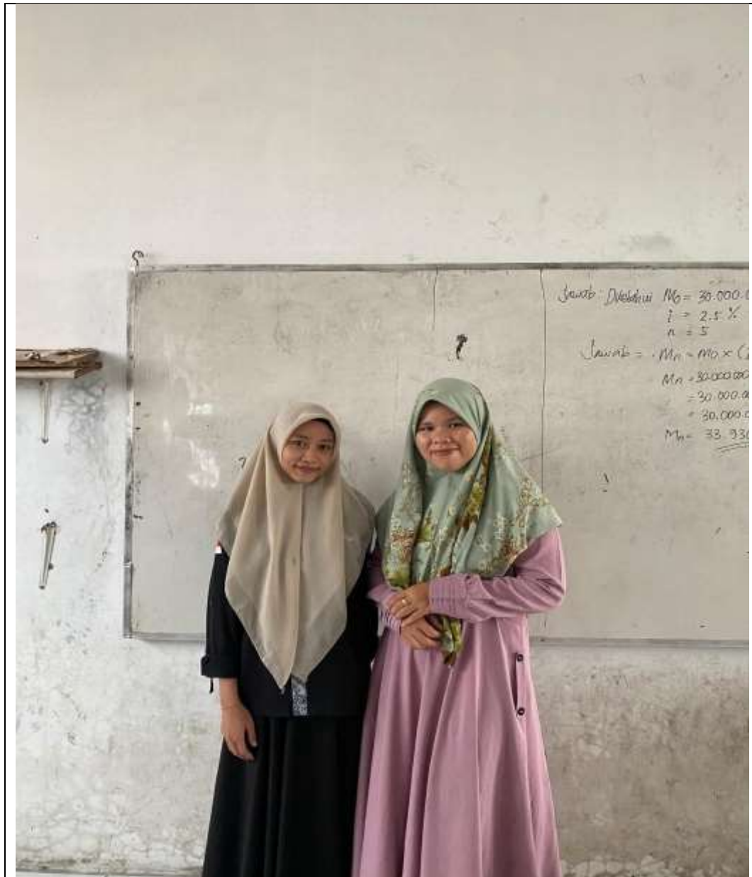
Gambar 2.6 foto bersama dengan guru Pendidikan Agama Islam SMK Muhammadiyah 06 Medan