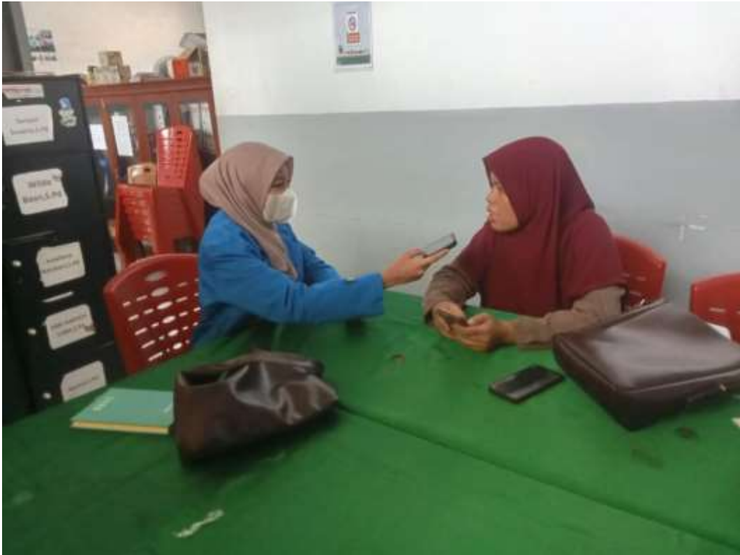
Gambar 2.2 Wawancara Dengan Guru PAI SMK Muhammadiyah 06 Medan