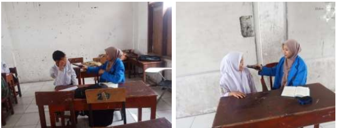
Gambar 2.3 Wawancara Dengan Beberapa Siswa SMK Muhammadiyah 06 Medan