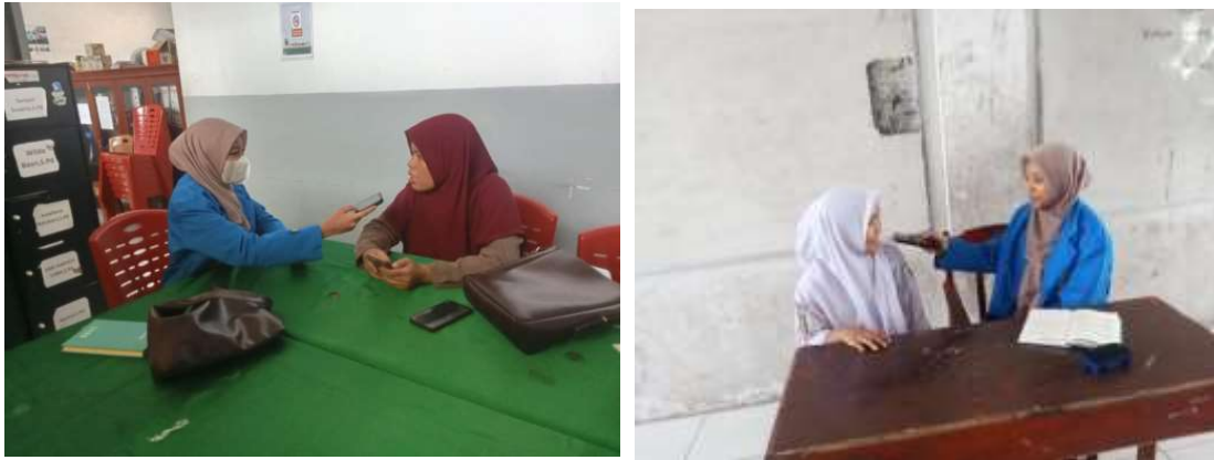
Gambar 2.2 pelaksanaan wawancara dengan guru PAI dan Siswa SMK

Wawancara: “Jujur aja, saya pernah mengalami perilaku bullying, seperti pukulan dan ejek-ejekan antarteman.