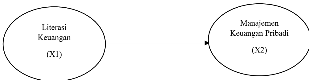
Gambar 2.1. Pengaruh Literasi Keuangan terhadap Manajemen Keuangan Pribadi

Maka disimpulkan bahwa literasi keuangan berpengaruh terhadap manajemen keuangan pribadi.